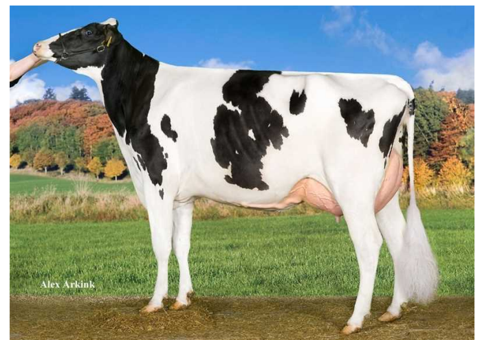
Tirsavad Bookem Nessie - MMM