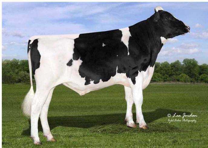
Bomaz Frisson - býk ze stejné rodiny

Curveball pochází z americké farmy Bomaz v Hammond ve Wisconsinu, kde je chováno 650 holštýnských krav. Rodina, ze které Curveball pochází, je ve šlechtění poměrně nová. Ze stejné rodiny pochází NEO-713 Bomaz Spring Forward. Zakladatelkou rodiny je v 9. generaci Bomaz Daggat D Pizza VG-87.