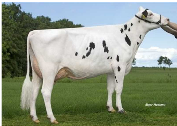
Koepon Bkm Regenia 104 - 4. gen. M