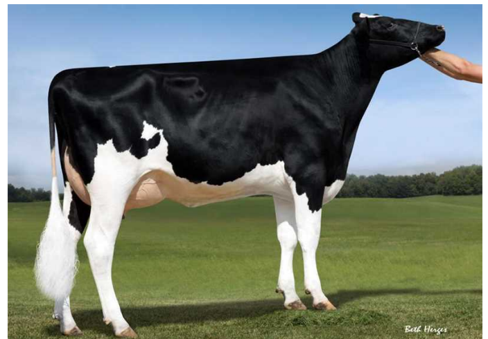
Ms Brody Jospr 32051-ET - 5. gen. M